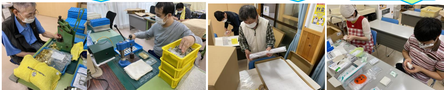
救急セットづくり

あっという間に季節が移り変わり、秋本番ですね。現在のB型の下請けのお仕事内容を少しご紹介いたします。新しく今年から取り組むものや、短期のもの、長年のものなど、色々な種類のお仕事に取り組んでおります。下請けの中で長年代表格として取り組んでいる製品は、パーフェクトゲージ工業さんのお仕事です。コンプレッサーの機械を使い、プレス等を行う精密作業です。他には、のし袋の組み立て作業や、救急セットの梱包、テイクアウト用弁当の箱折りや、(株)PAEさんのケーブル作業、(有)北沢ハーネスさんのトヨタの部品など多種多様な仕事に携わり、ひとつひとつ丁寧に取り組んでおります。このコロナ禍でこうしてお仕事を頂けることはとても有り難いです。また毎日繰り返し同じ工程の作業であっても、集中して取り組む姿勢、短期のお仕事も新たに覚えて真剣に取り組む姿勢、それぞれに頑張っている姿勢を、これからも見守りください。