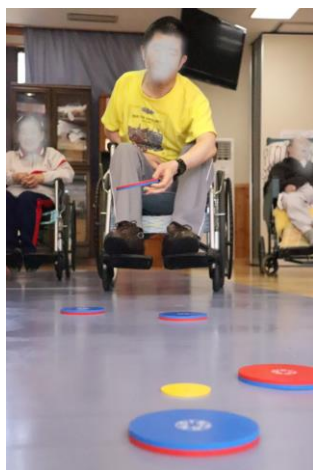
ディスクン!黄色の的めがけて・・・それっ!