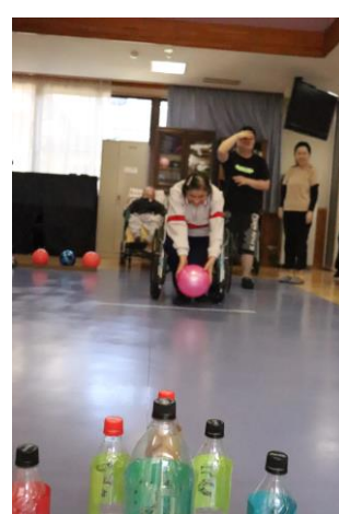
ペットボトルボーリング